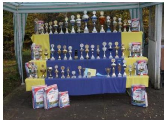
Pokale Tisch Sonntag