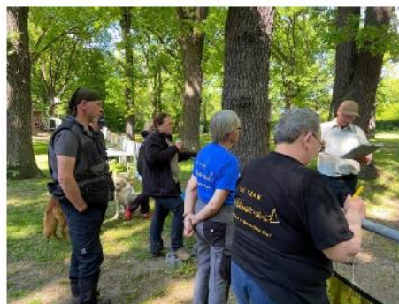
Richterbesprechung Abt. B