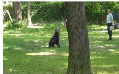
Abt. B Yvonne und Guro