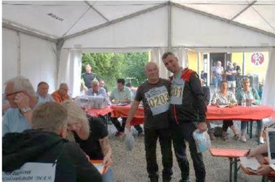
Auslosung im Festzelt