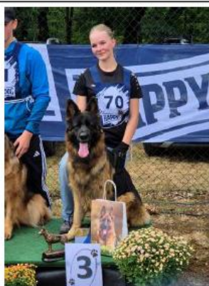
L - GHKL H V3 Wanda vom Prierosee