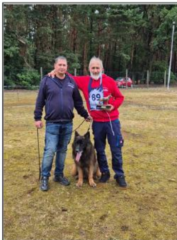
L - VetK R Platz 1 Zarek von Honduras