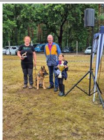
VetK H Platz 1 Vritzie vom Olwenhof