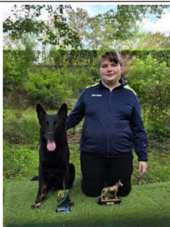
GHKL R V6 Guandi vom Falkenseer Stern