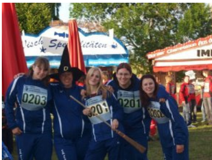
Deutsche Jugend und Juniorenmeisterschaft 2009 in Gera